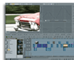
Movimento rallentato dinamico