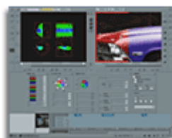
Correzione di colore CX